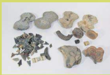
女方遺跡 (茨城県) 採集資料