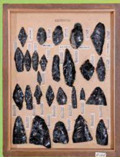
白滝遺跡 (北海道) 採集 打製石器