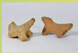
新沢千塚 (奈良県) 採集 土馬