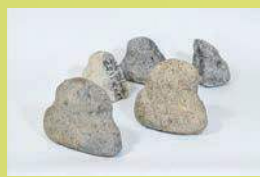
北海道余市町採集 石冠