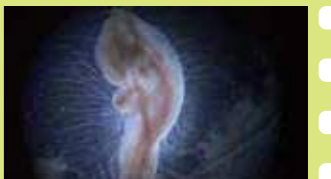
からだの中の宇宙 ー超高精細映像が解き明かすー