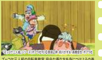
ズッコケ三人組の自転車教室 安全な乗り方を身につけようの巻