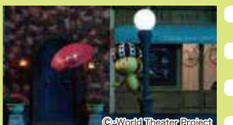
映画の妖精 フィルとムー