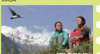
A Seed of Hope