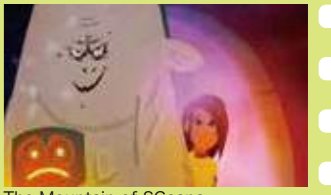
The Mountain of SGaana