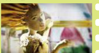
The Blissful Accidental Death