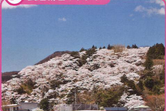
7 長沼城址のサクラ