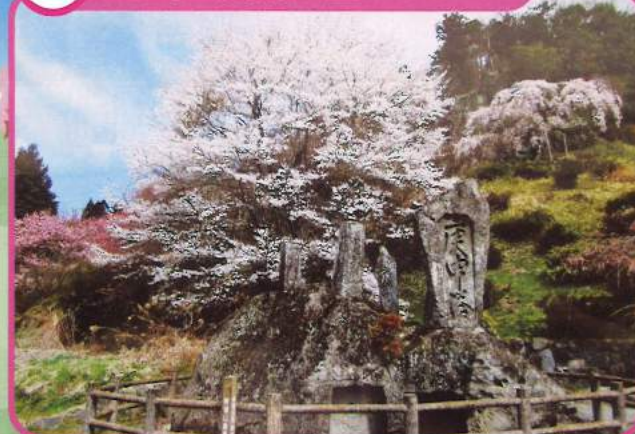
3 岩崎山史跡公園のサクラ