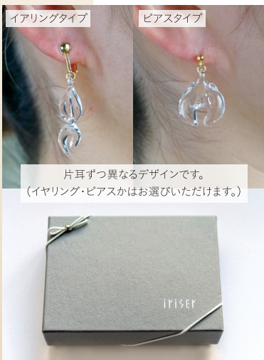
イヤリングタイプ